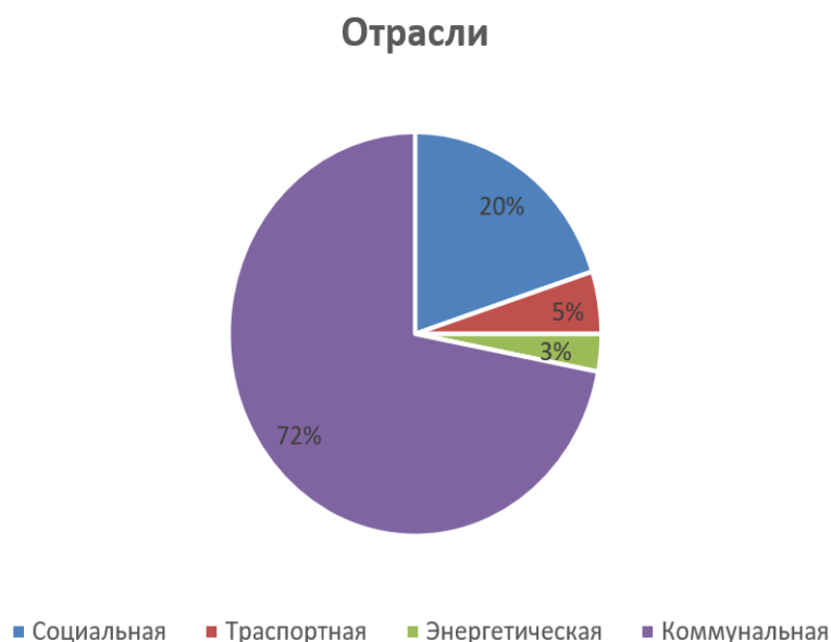
Рис.1. Основные инфраструктурные направления ГЧП в России

Проекты ГЧП в России распределены по четырем основным инфраструктурным направлениям. Во-первых, в части коммунальной инфраструктуры 194 проекта. Во-вторых, на социальную инфраструктуру приходится 165 проектов. В-третьих, в энергетической инфраструктуре имеется 163 проекта и, наконец, в-четвертых, в транспортной инфраструктуре – 64 проекта. Мировая практика свидетельствует, что в разных отраслях механизмы ГЧП осваиваются неравномерно, куда-то ГЧП приходит раньше, куда-то позже. Российское отраслевое распределение в целом свидетельствует о выходе отечественного рынка ГЧП на уровень, характеризующийся, с одной стороны, наличием необходимого объема предложения объектов под реализацию проектов ГЧП со стороны публичного партнера, с другой – сопоставимым уровнем заинтересованности частного инвестора в инвестициях на проекты в различных сферах. То есть, и сами созданные условия в разных отраслях можно назвать адекватными, что характерно для уровня развития рынка, прошедшего этап становления [3].