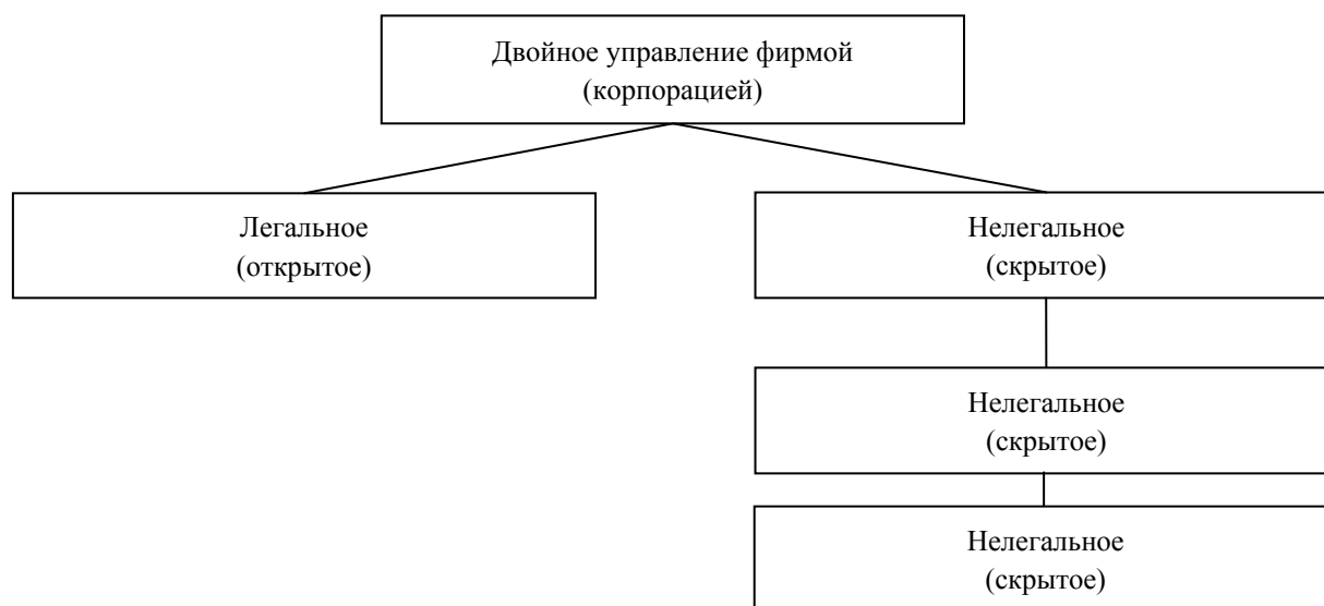
Рис. 1. Схема скрытого влияние на бизнес и власть

двойного управления экономикой. Но это лишь начало большой работы по институционализации отношений «бизнес – власть».