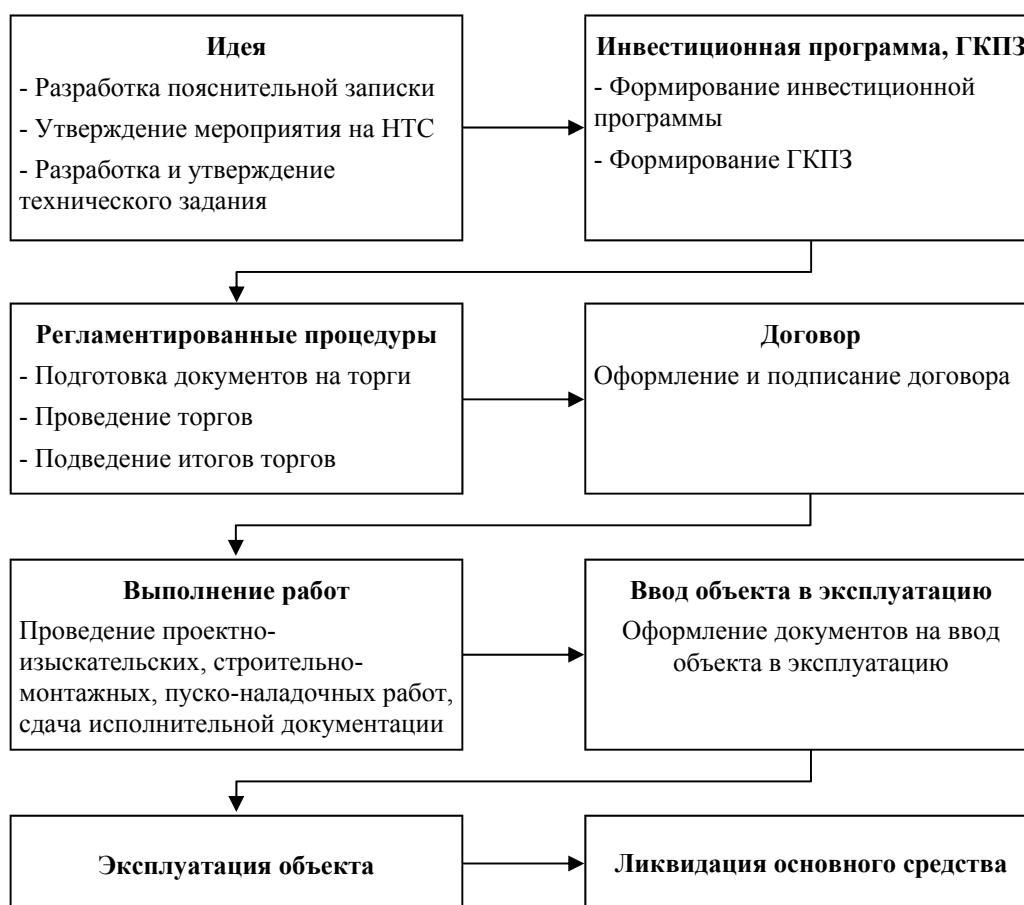
Рис. 1. Общая схема процесса обновления основных производственных фондов ОАО «ТГК-2»

Следующий этап процесса обновления основных средств – формирование инвестиционной программы (ИПР). Инвестиционная программа – это документ, содержащий перечень объектов капитальных вложений, их основных характеристик, стоимости, объемов и источников финансирования. Данный документ составляется на один календарный год и/или на другой определенный период времени (обычно на срок 3 или 5 лет). При формировании ИПР в энергетике придерживаются таких принципов, как срочность и значимость мероприятия, их экономическая эффективность, необходимость исполнения обязательств Компании перед надзорными органами, органами власти и сторонними контрагентами. ИПР одобряется Правлением Общества и утверждается Советом директоров ОАО «ТГК-2»