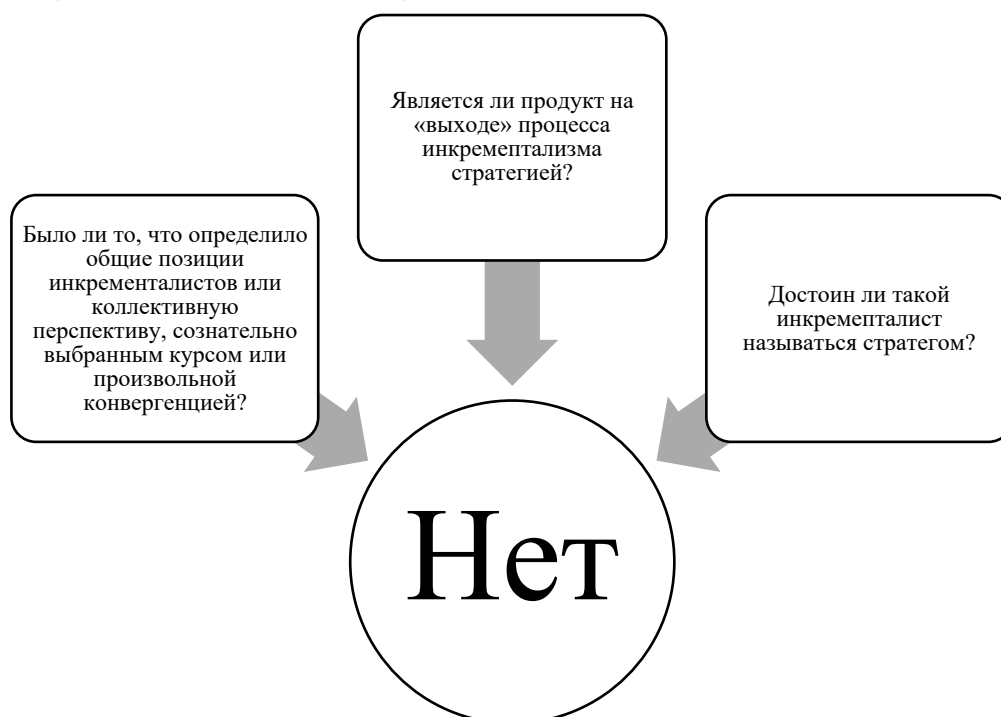
Рисунок 3 - Результаты поиска исследователей ответа на вопросы, связанные с частным инкрементализмом [32].

В поисках ответа на вопросы, связанные с частным инкрементализмом (рис. 3), исследователи пришли к выводу о том, что «никакого другого ответа, кроме «нет», быть не может» [32].