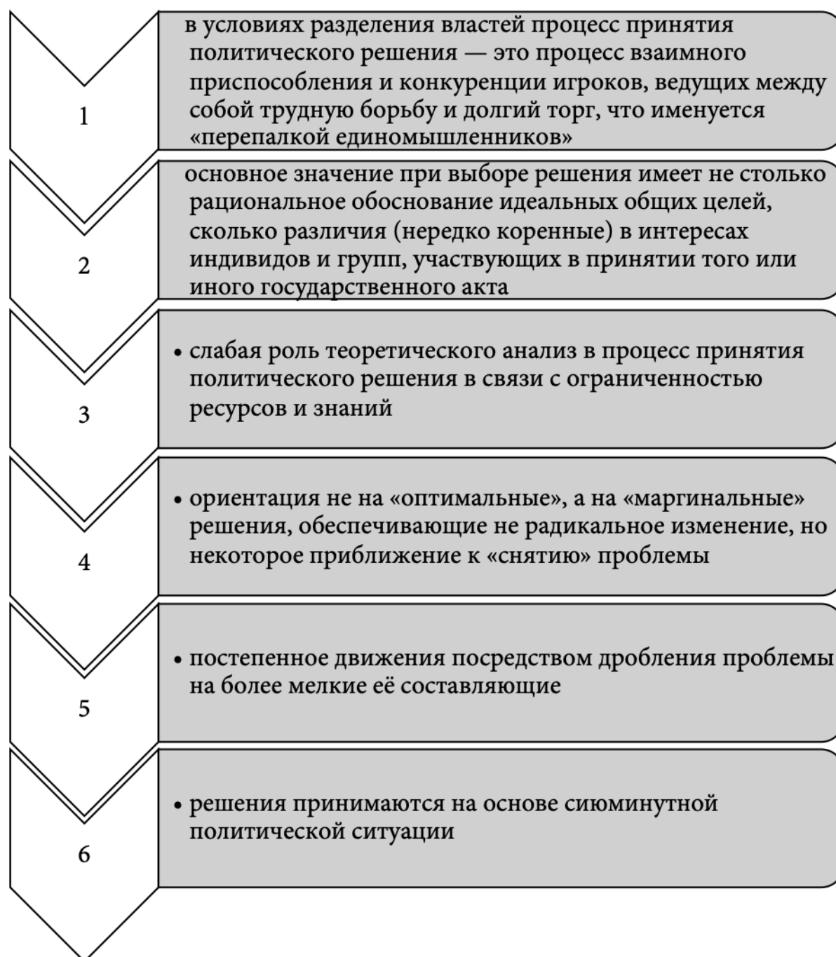
Рисунок 2 - Основные идеи концепции инкрементализма, выделенные Ч. Линбломом [35].

Эволюция школы обучения Ч. Линблома, описывающая процессы возникновения и развития обучающей модели базируется на анализе стадий ее развития, первая из которых обусловлена развитием частного инкрементализма, описанного Ч. Линбломом и Д. Брейбруком в работе «Стратегия принятия решений» [33].